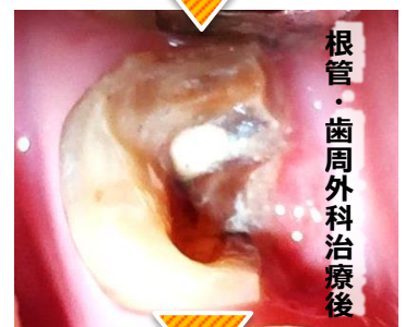
根管・歯周外科治療後