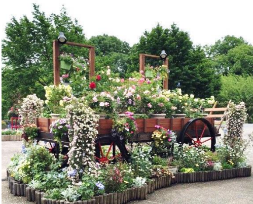
《様々なバラが綺麗に咲いていました》

結婚式翌日、少し時間があったので、大山の麓にあるフラワーパーク『鳥取花回廊』に行ってきました。私が行った時にはちょうど、バラが満開の時期でしたので、様々な種類のバラを楽しむことができました。米子駅からも無料シャトルバスが出ているようですので、山陰方面にお越しの際は是非行って見て下さい！