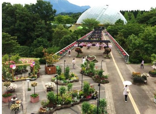
《奥のドームは温室です》